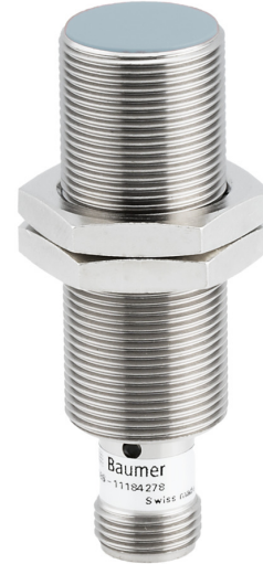
图片与实际产品相似