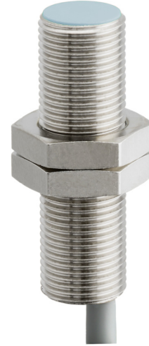
图片与实际产品相似